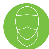
NOUVELLES PRATIQUES/ INNOVATION-DÉVELOPPEMENT